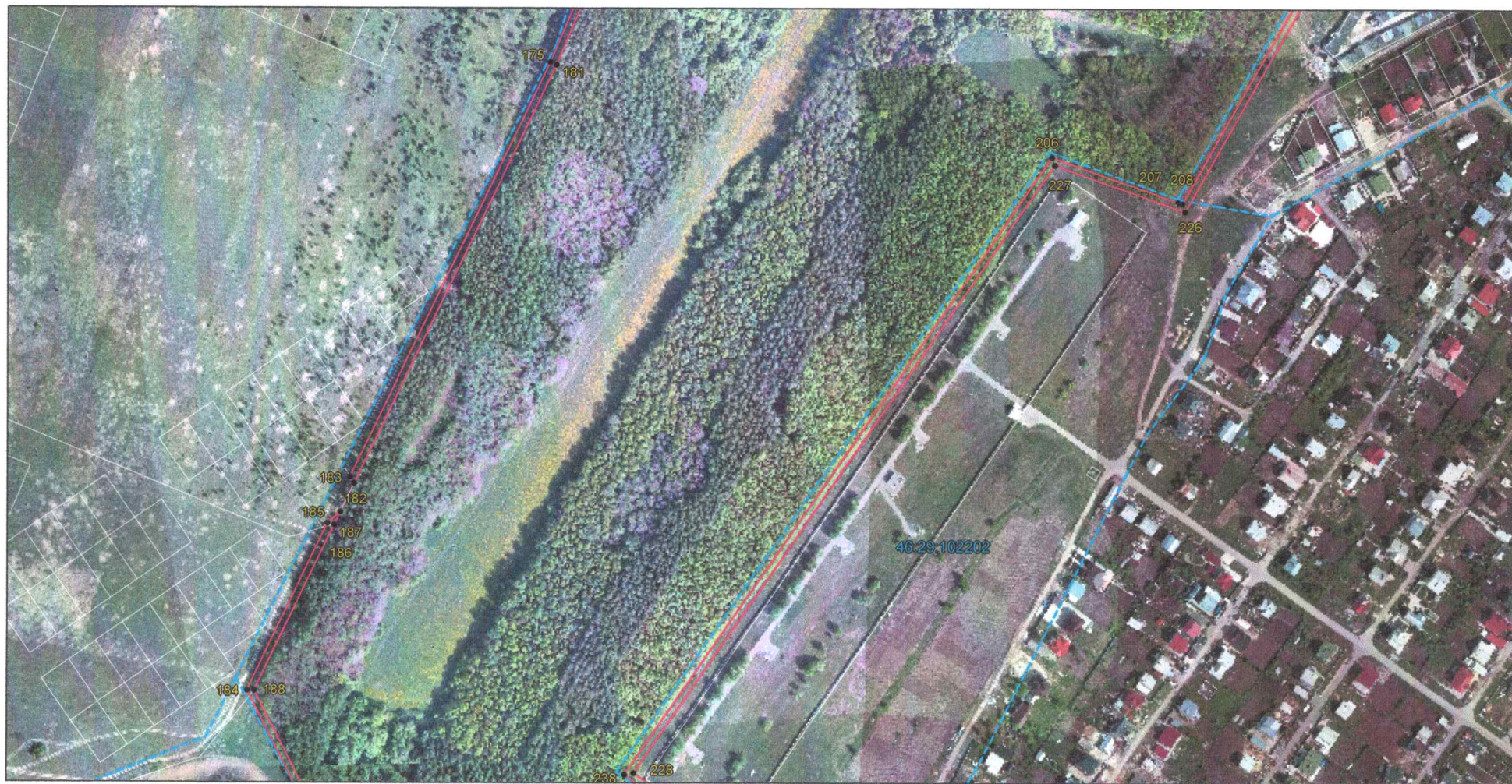
Выносной лист 8