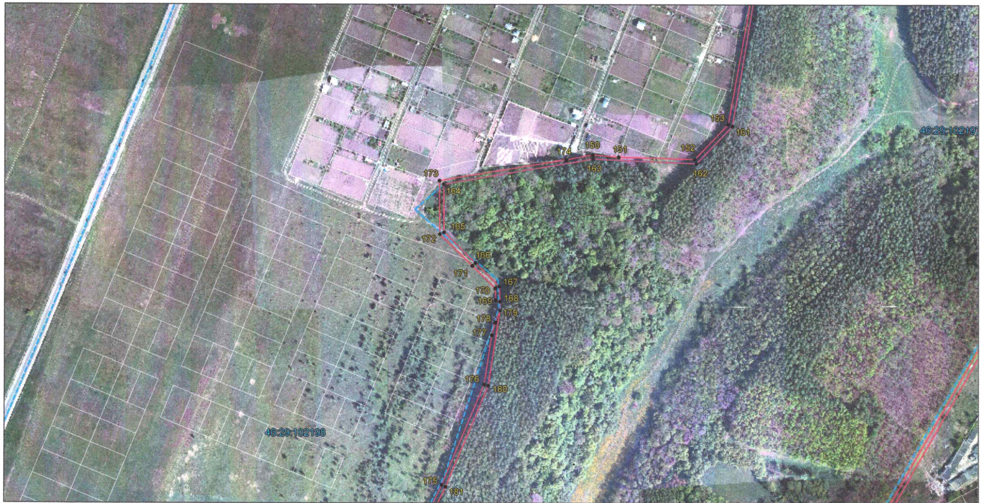
Выносной лист 7