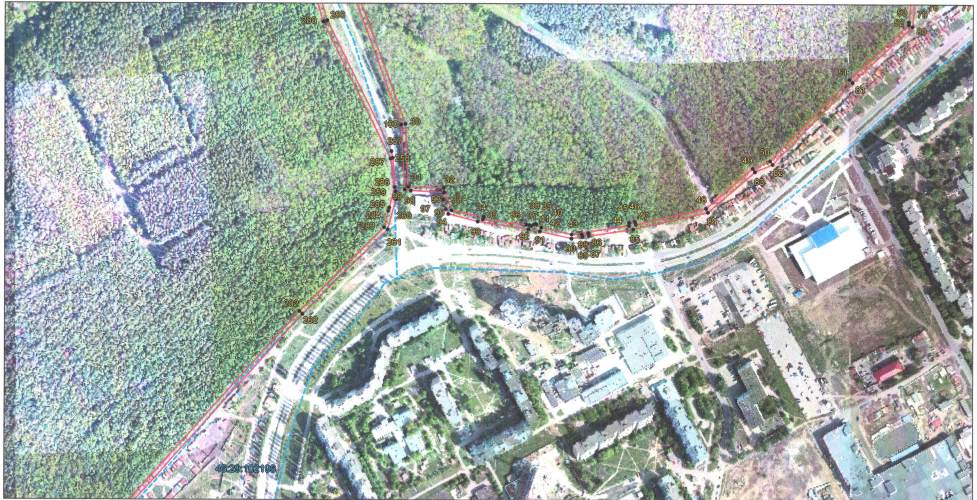
Выносной лист 3