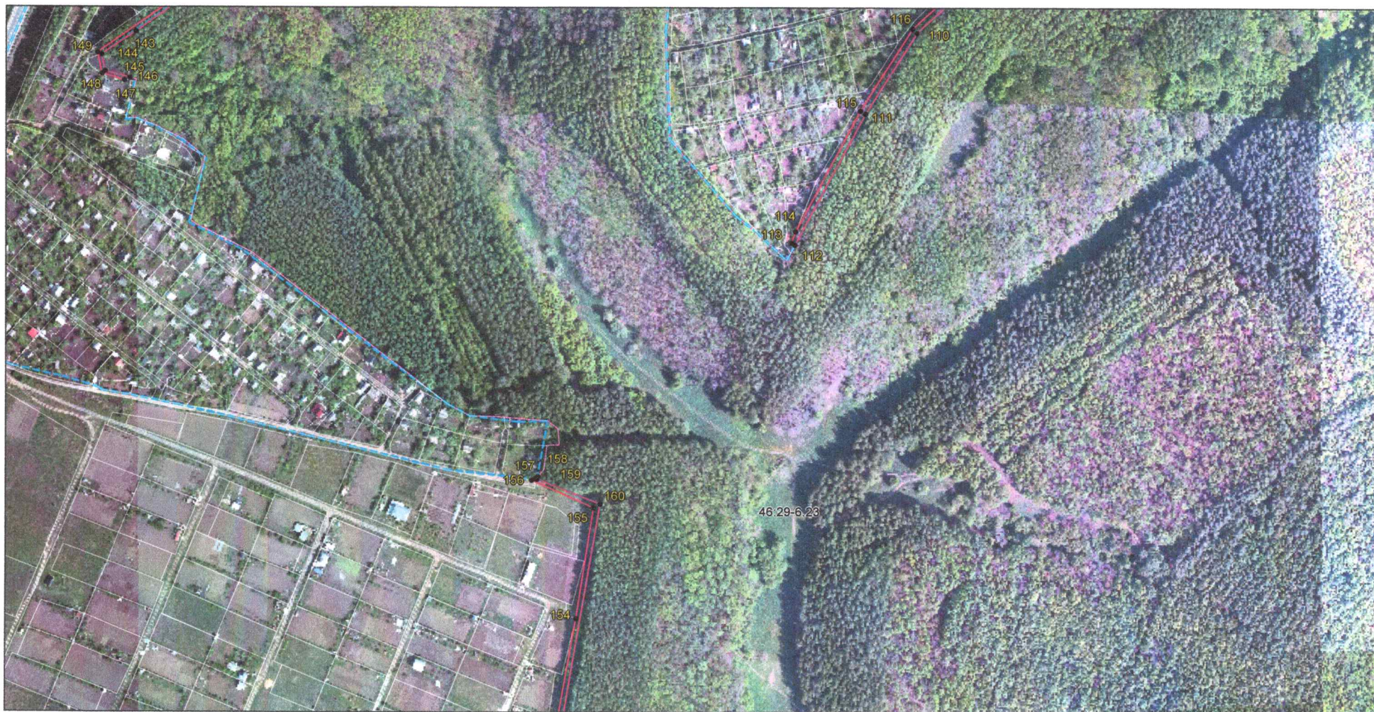
Выносной лист 5