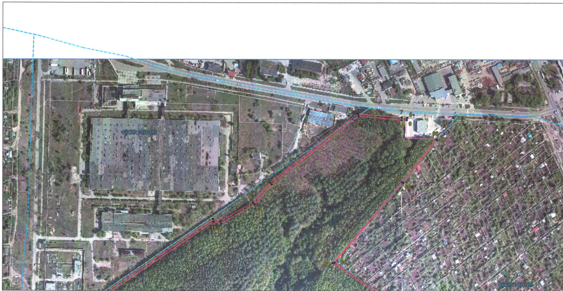
Выносной лист 2