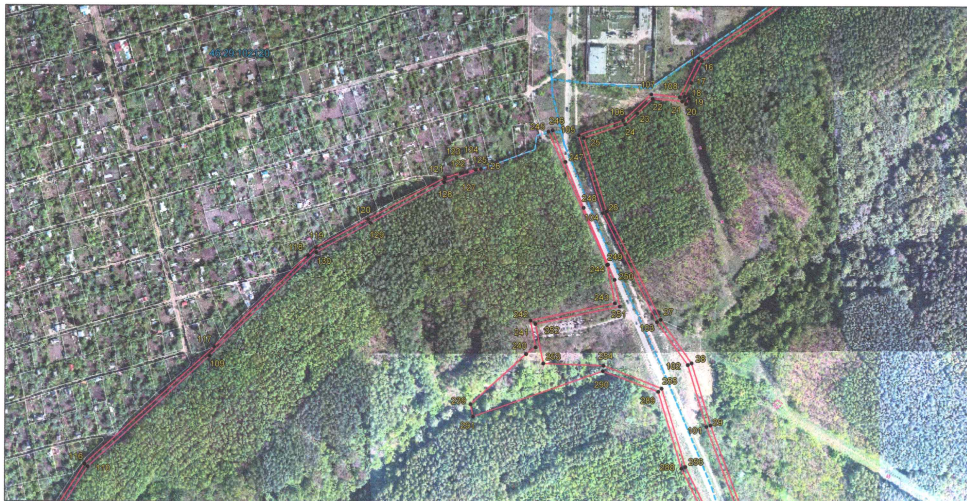
Выносной лист 1