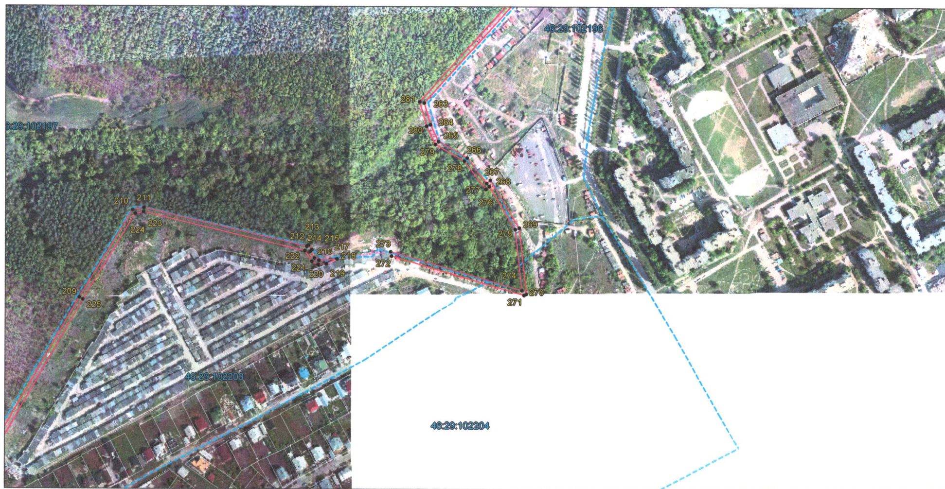
Выносной лист 10